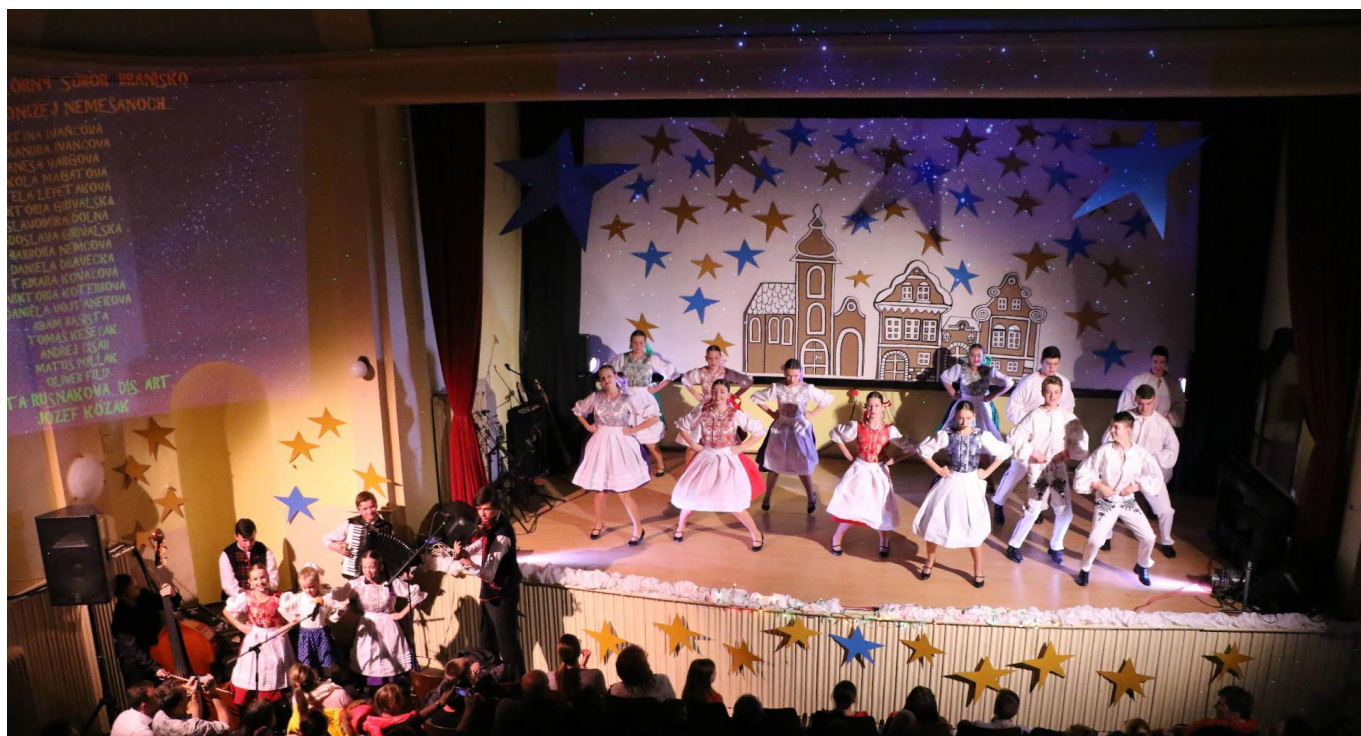
obr. č. 1

Premiérové vystúpenie DFS Branisko Vianočný koncert 2016