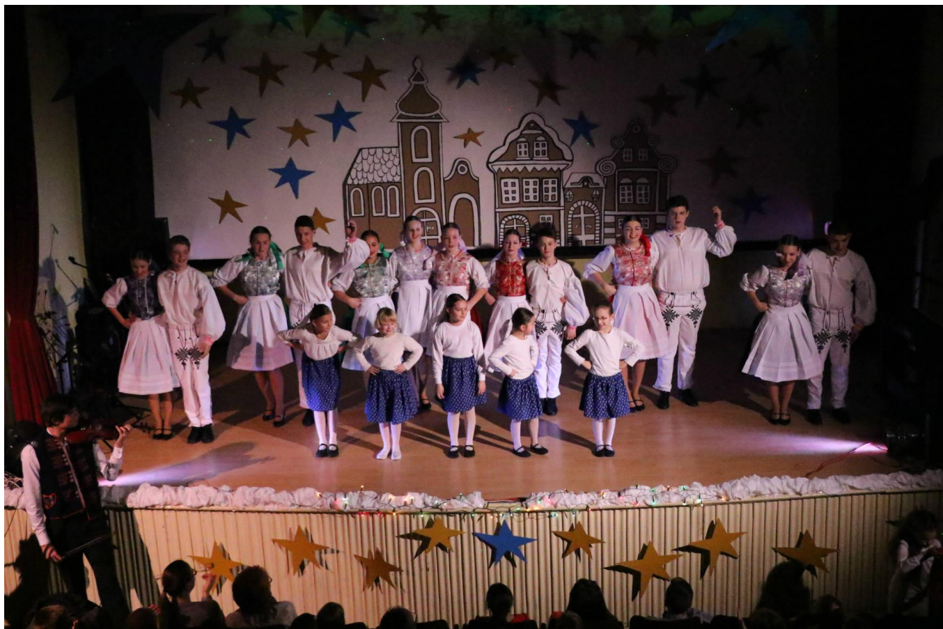
obr. č. 2 DFS Branisko Vianočný koncert 2016