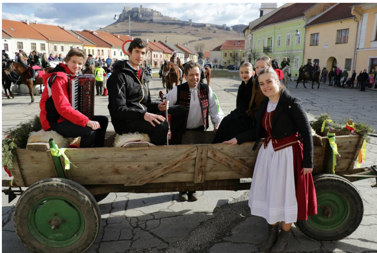
obr. č. 3 Fašiangová jazda mestom spojená s pochovávaním basy