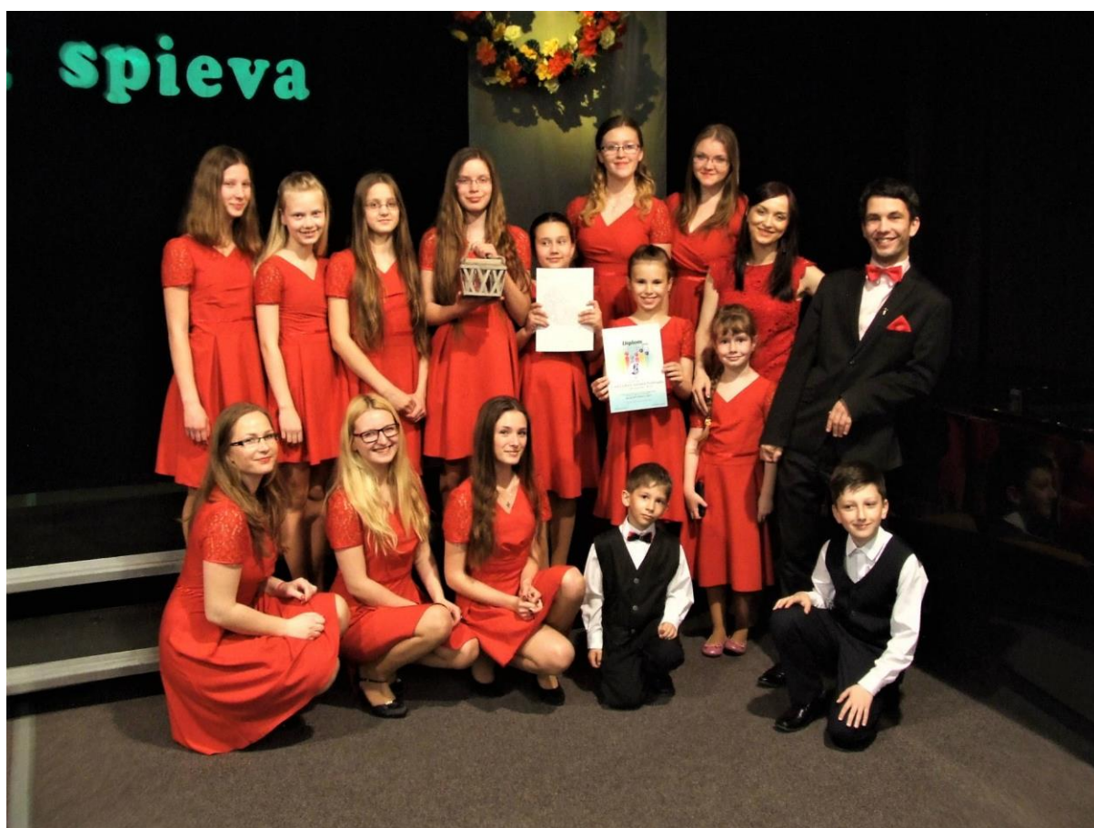
obr. č. 4 Spevácky zbor Cantabile na súťaži Mládež spieva 2017 Vranov nad Topľou