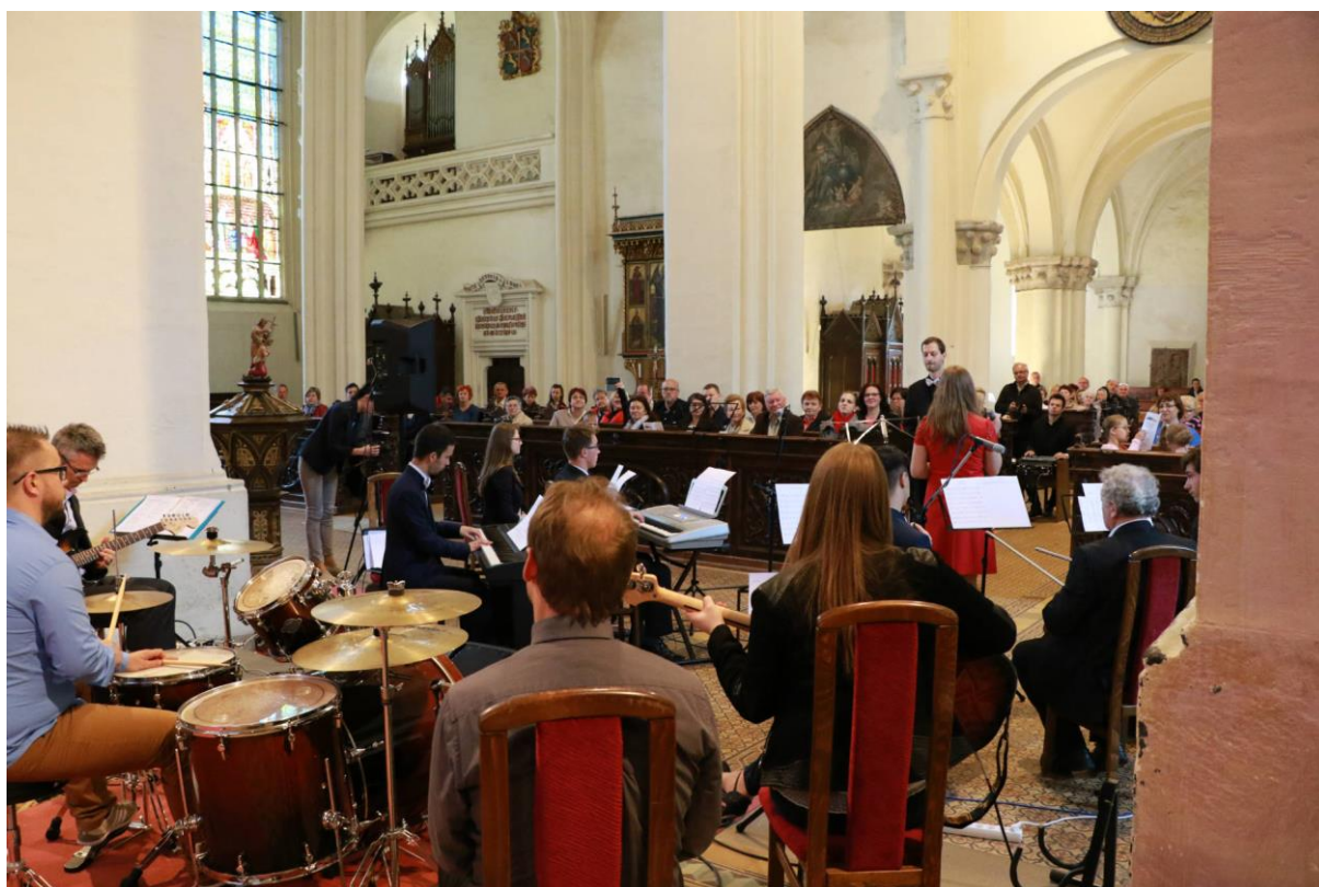
obr. č. 7 Projekt populárnej hudby Spišský Jeruzalem 2017