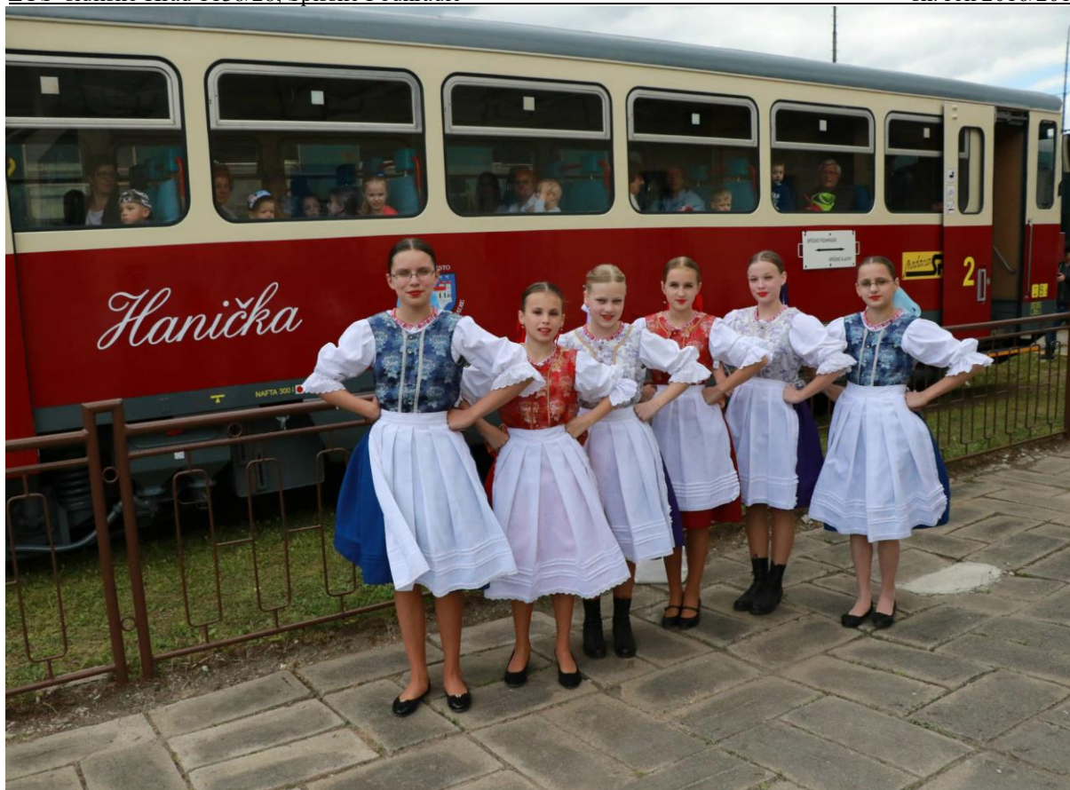
obr. č. 6 Návrat „Haničky“ pod Spišský hrad