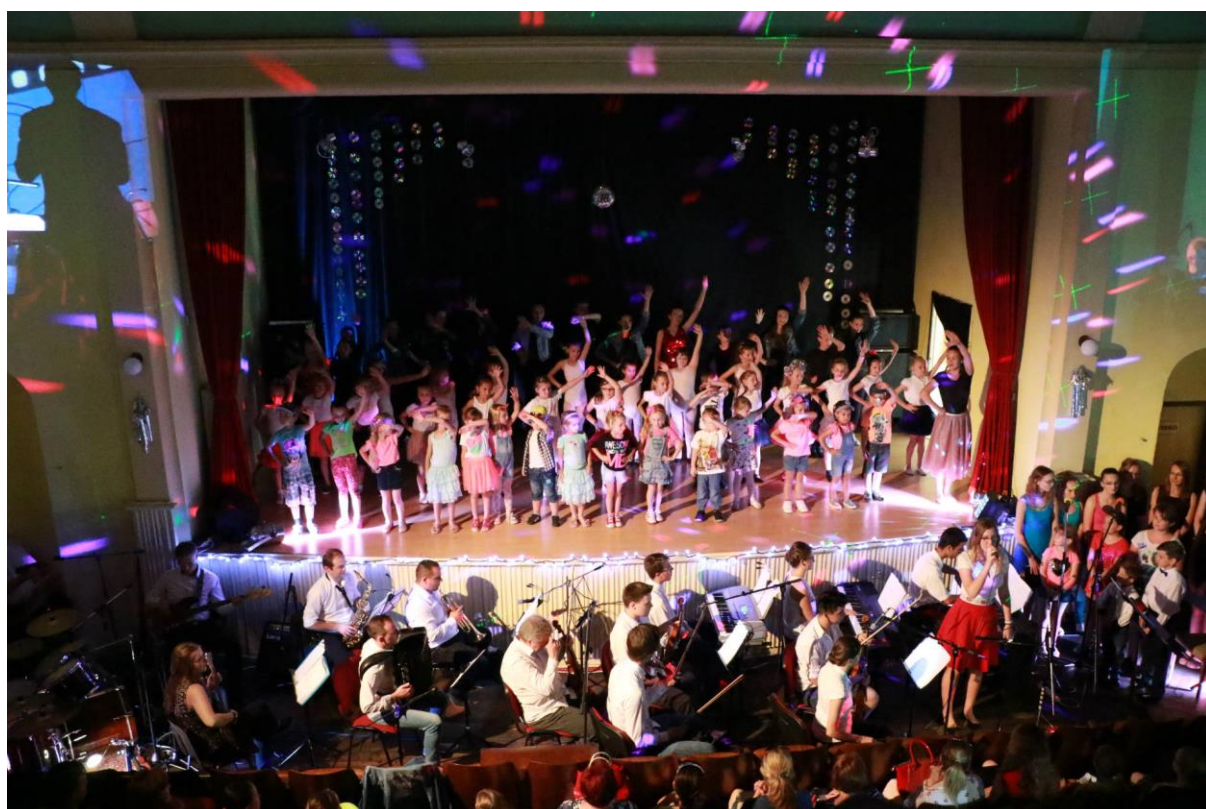
obr. č. 9 Pop Op Art koncert