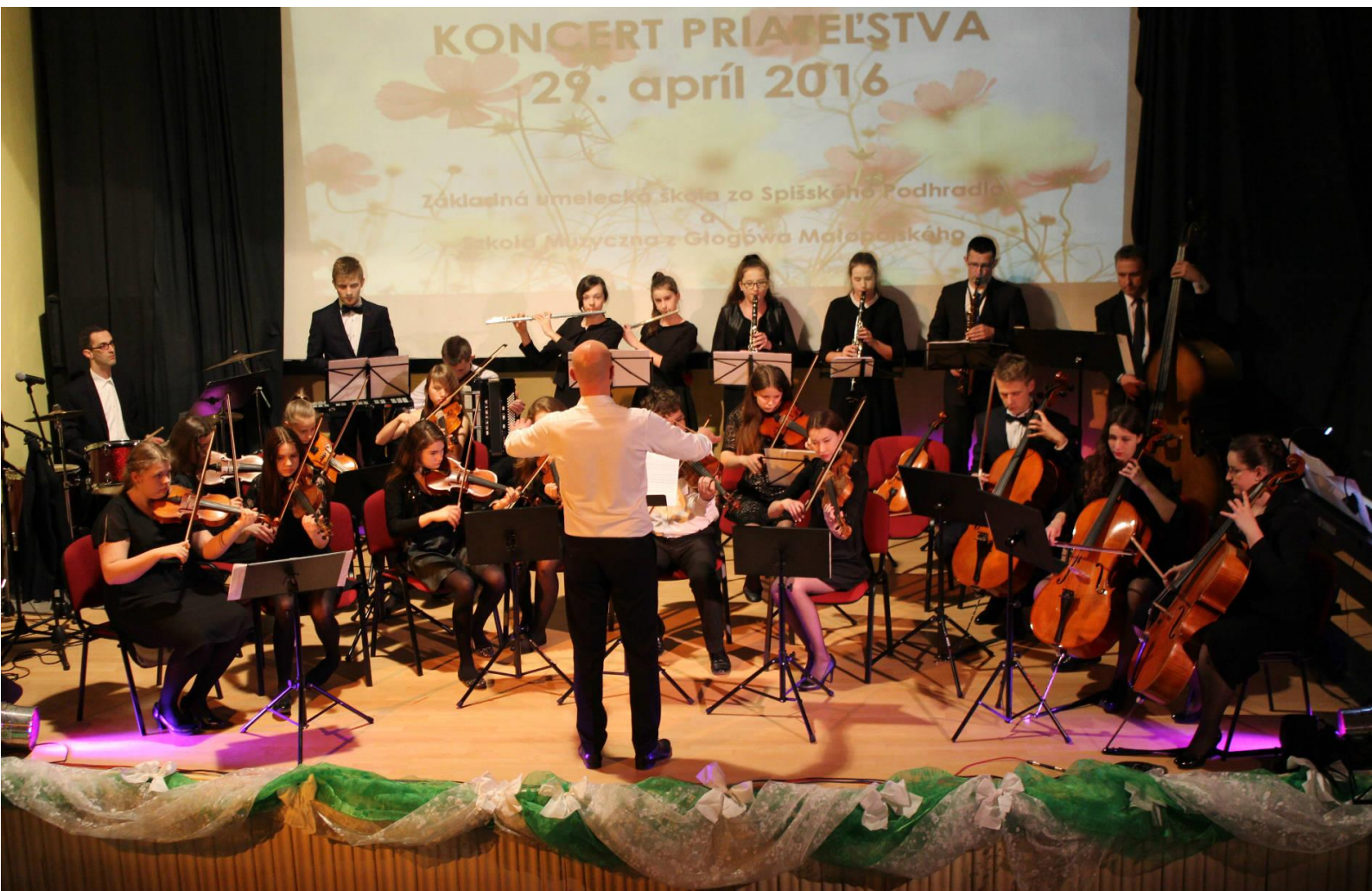
obr. č. 5 - Koncert priateľstva, Szkola Muzyczna z Glogowa Małopolského