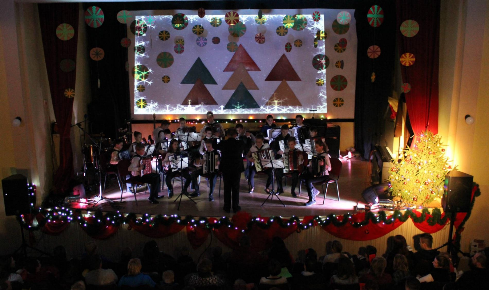
obr. č. 3 - Vianočný koncert, Akordeonik - akordeónový orchester ZUŠ