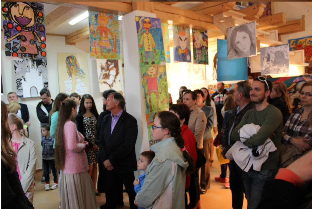
obr. č. 6 - Vernisáž výstavy v Dome pôvodných remesiel