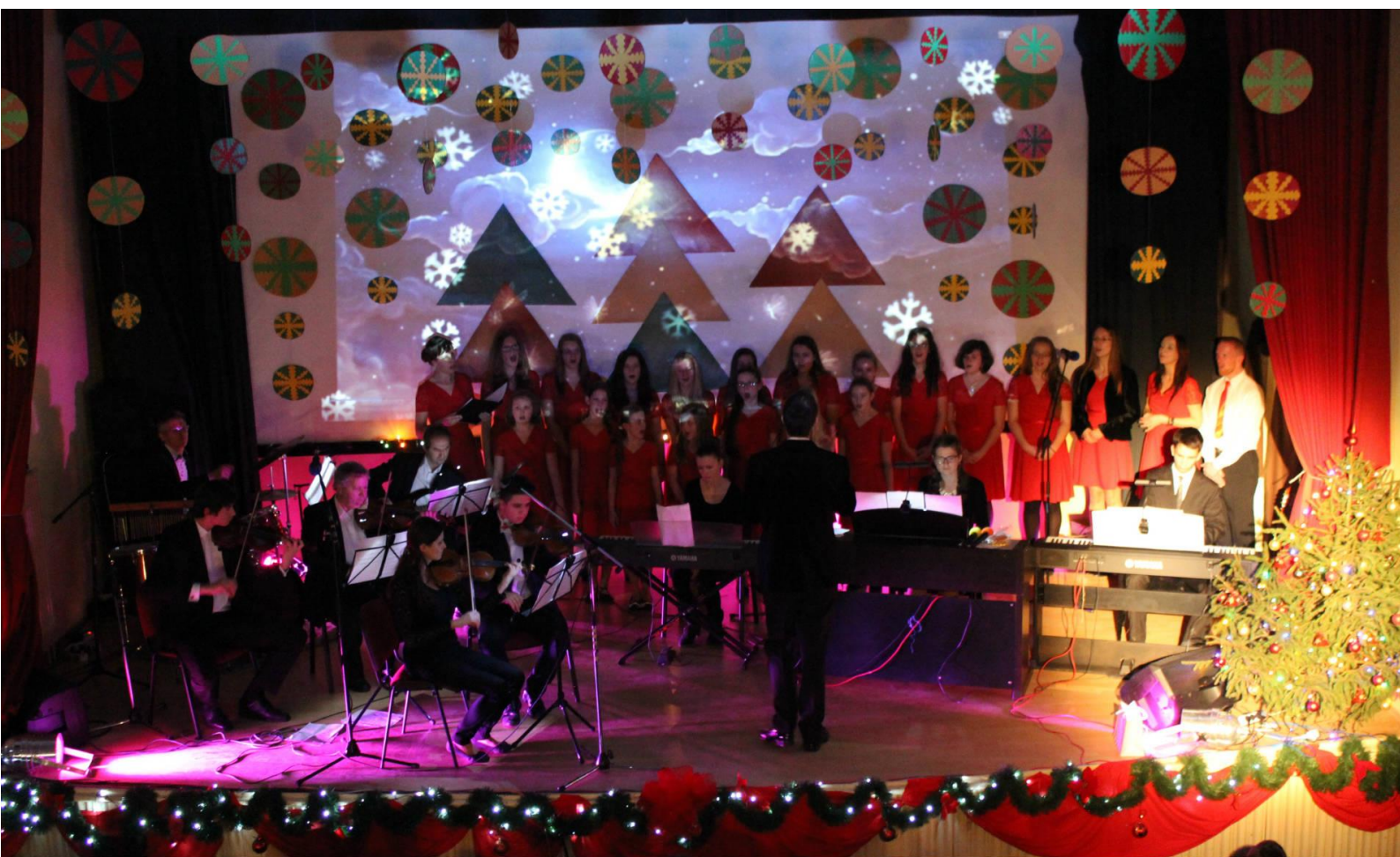
obr. č. 2 - Vianočný koncert, Orchester ZUŠ