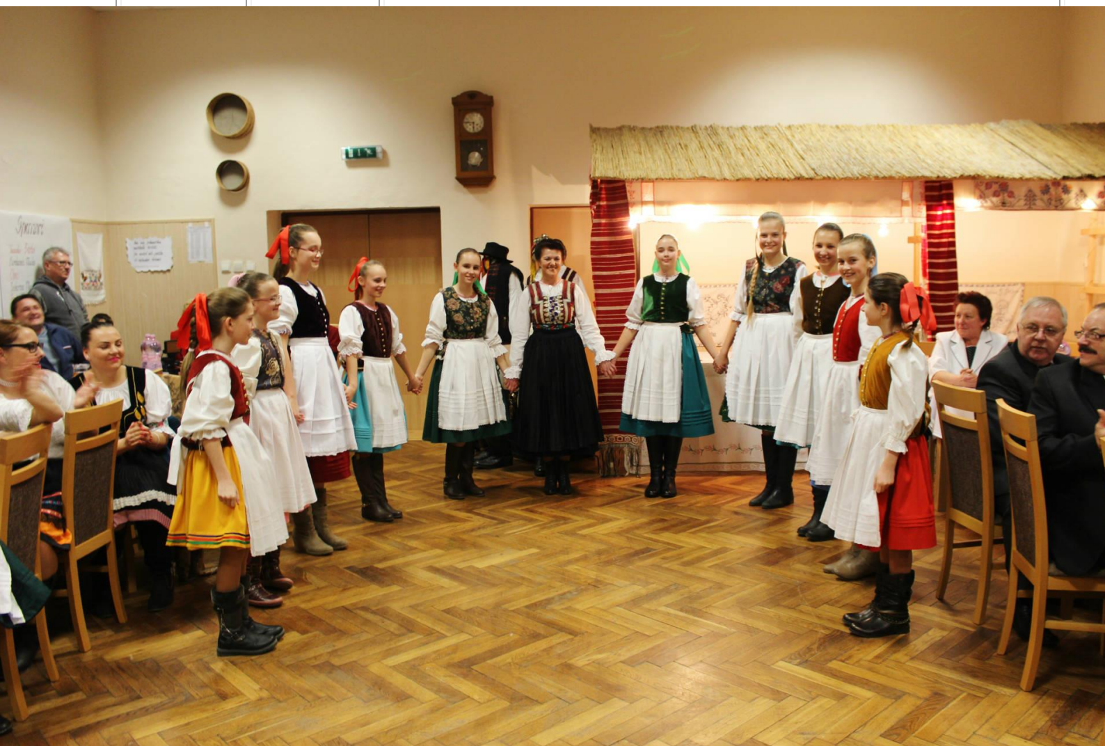
obr. č. 4 - DFS Dreveník na fašiangovej zábave v obci Nemešany