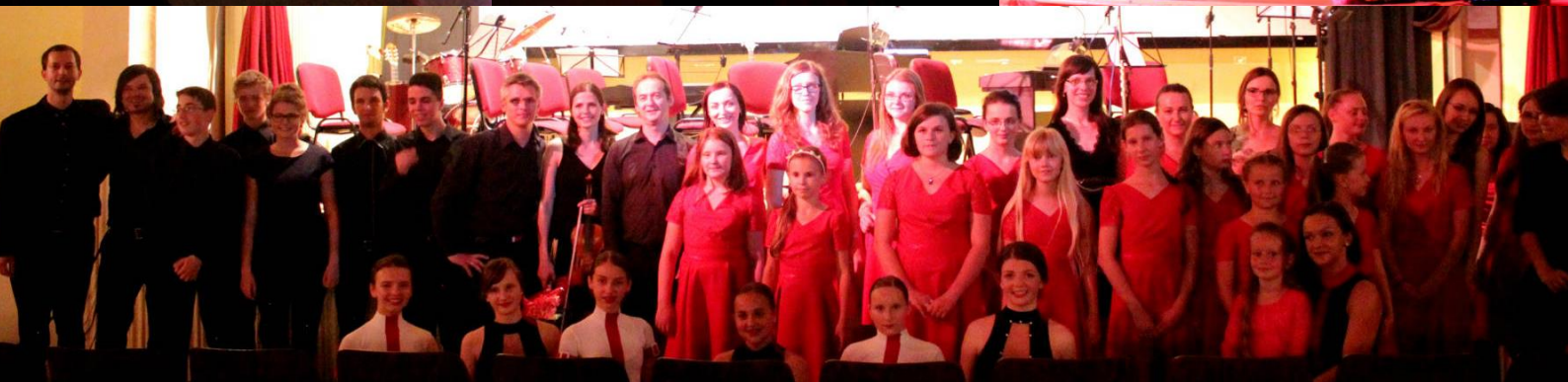
obr. č. 7 - Koncert filmovej hudby